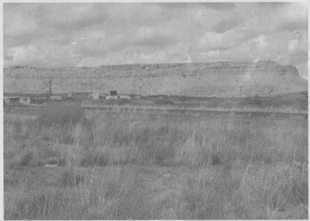
ホビ族保留地の中心近くにある Kykotsmovi Village (Google map より)

どの地下資源が発見されたため、これらの採掘のために一時彼らの居住権が脅かされたが、採掘企業がホビ族に補償金を支払うことで合意した。前述で紹介した伝統的な農法で耕される農地や農民の数は現在では著しく減少し、住民は主に公共事業や私企業での雇用労働によって生計を立てている。生活様式や食生活も著しく変化し、糖尿病や肥満を患う人々の割合が高くなっていくことである。