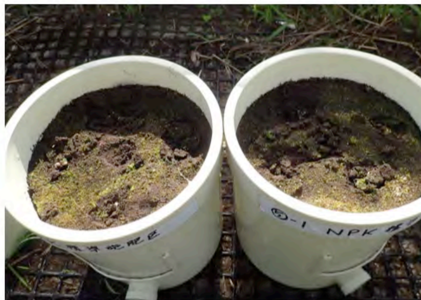
NPK 標準区 (右)