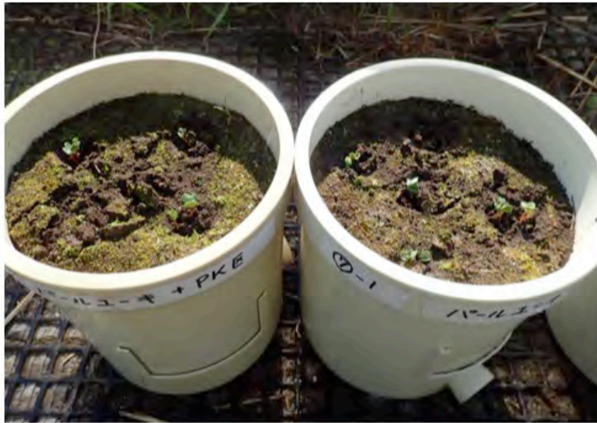
パールユーキ区 + PK (左)