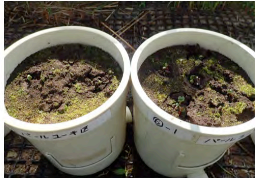
パールユーキ区 (右)