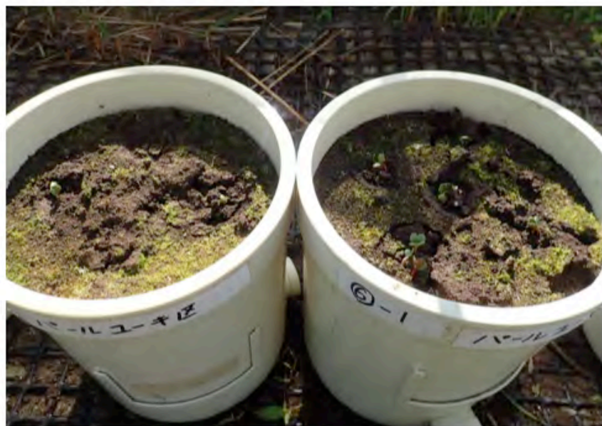
パールユーキ区 (左)