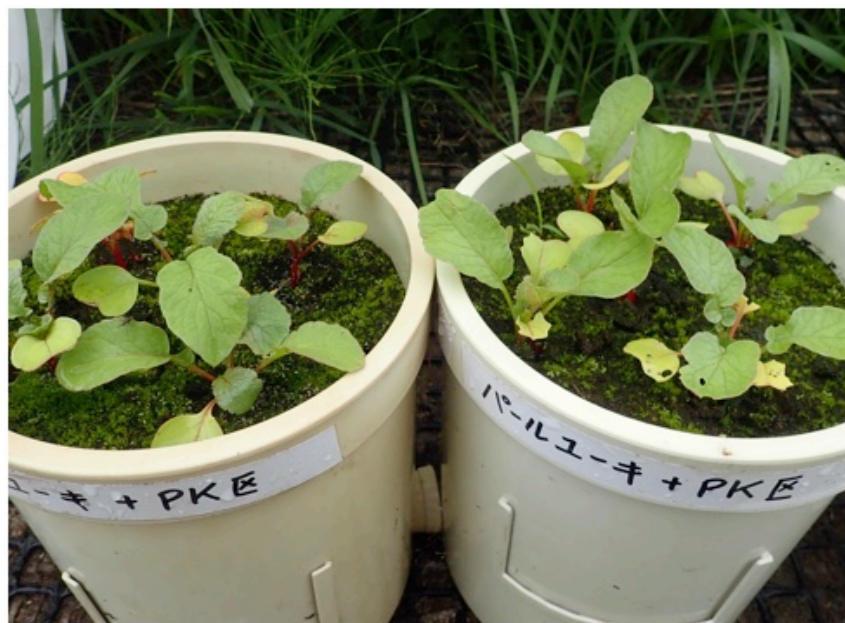
パールユーキ 区 + PK (左)