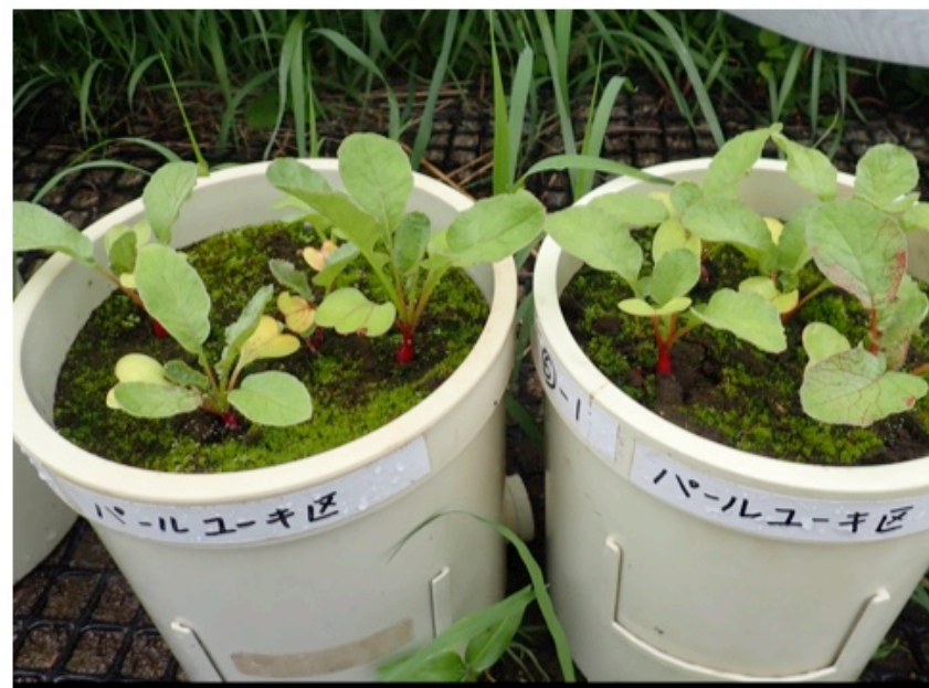
パールユーキ区 (右)