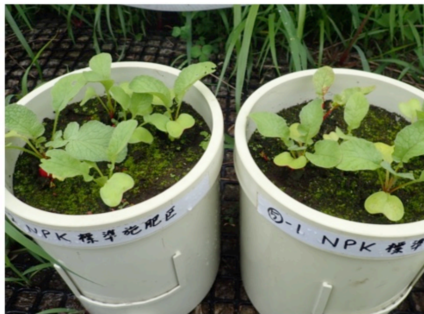
NPK 標準区 (右)