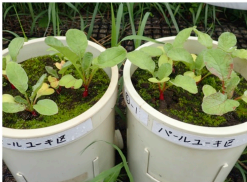
パールユーキ区 (左)